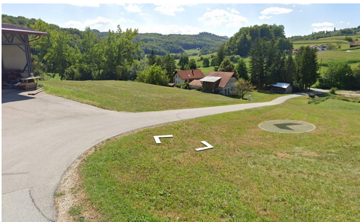
Slika 8: obstoječ cestni priključek; vir: Google street

Predmetna LP s širitvijo stavbnih zemljišč nima direktnega vpliva na infrastrukturno opremljanje.