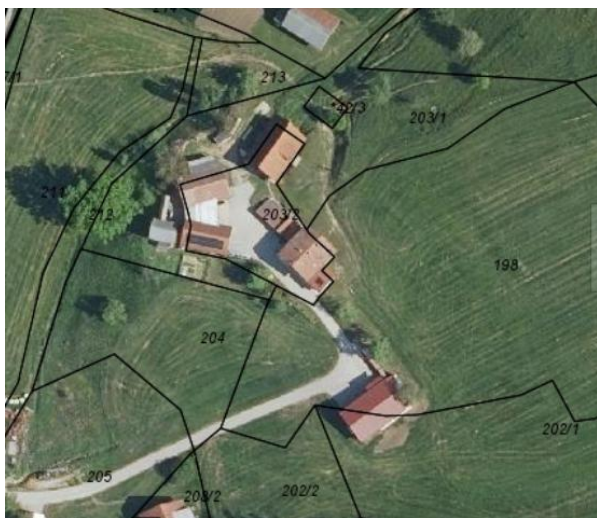
Slika 1: ŠIRŠI PRIKAZ V PROSTORU - DOF

Na širšem območju lokacijske preveritve je tradicionalno prisoten vzorec območij razpršene (posamične) poselitve, ki predstavlja avtohtono obliko poselitve tega območja. Ohranjanje in zaokroževanje avtohtonih območij poselitve je pomembno tako za ohranjanje obstoječega poselitvenega vzorca kakor tudi za ohranjanje tradicionalne kulturne krajine, ki se je oblikovala skozi stoletja.