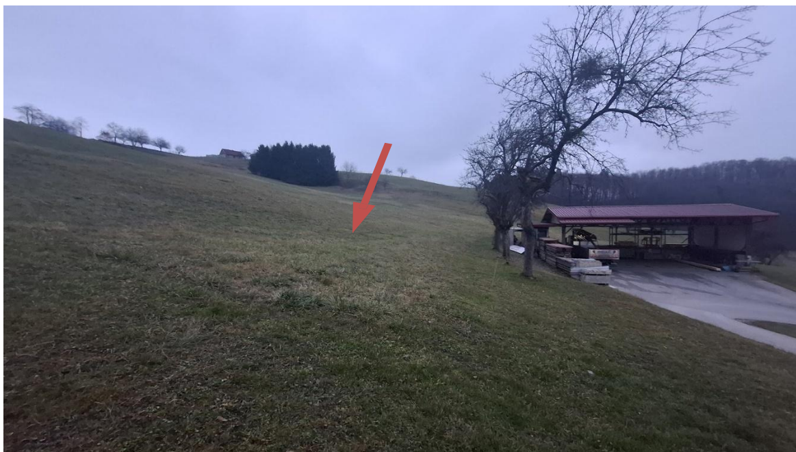
Slika 7: predvidena lokacija stanovanjskega objekta