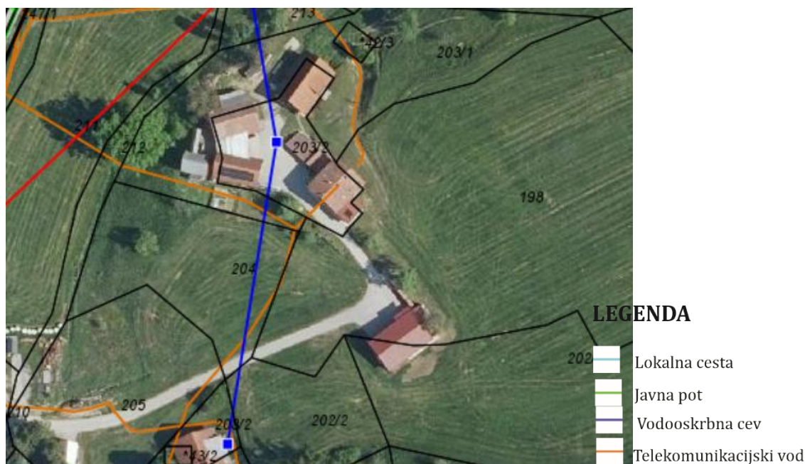
Slika 6: PRIKAZ GJI; vir: IObčina.

Projektna dokumentacija za gradnjo stanovanjskega objekta bo izkazovala ustrezno infrastrukturo opremljenost in priključevanje na infrastrukturo, za kar bo potrebno pridobiti mnenja od pristojnih upravljavcev infrastrukture.