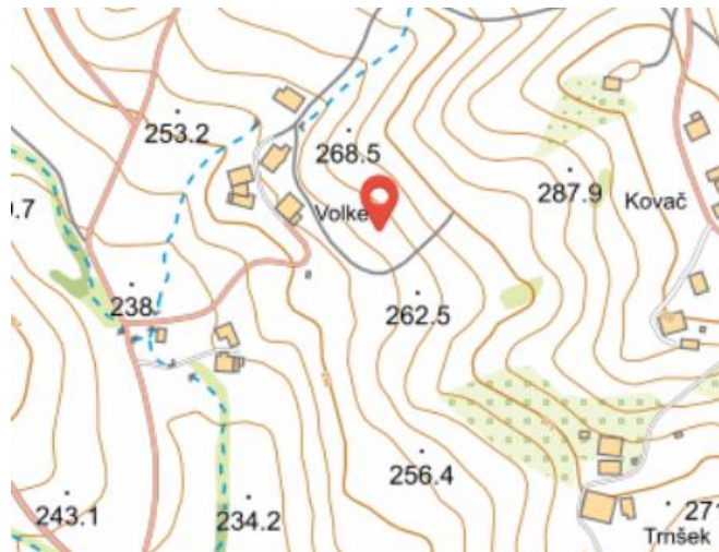
Slika 2: ŠIRŠI PRIKAZ V PROSTORU-TOPOGRAFIJA