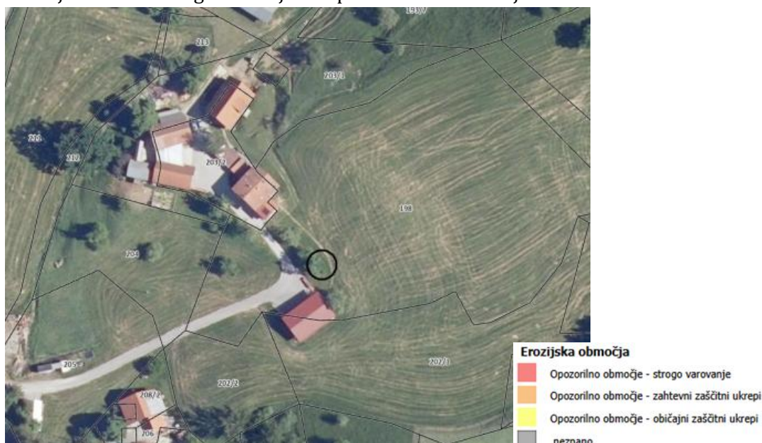
Slika 9: OGROŽENA OBMOČJA - EROZIJSKO OBMOČJE

Na podlagi pridobljenih podatkov opozorilne karte za Republiko Slovenijo je bilo ugotovljeno, da obravnavano območje ne spada v območje erozijskih ukrepov. Na spodnji sliki je označena lokacija obravnavanega območja na opozorilni karti erozije.