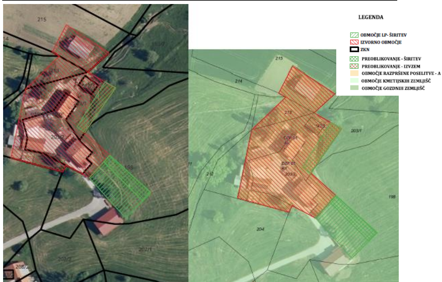
Slika 3: PRIKAZ OBMOČJA LP NA DOF IN NA IZSEKU OPN