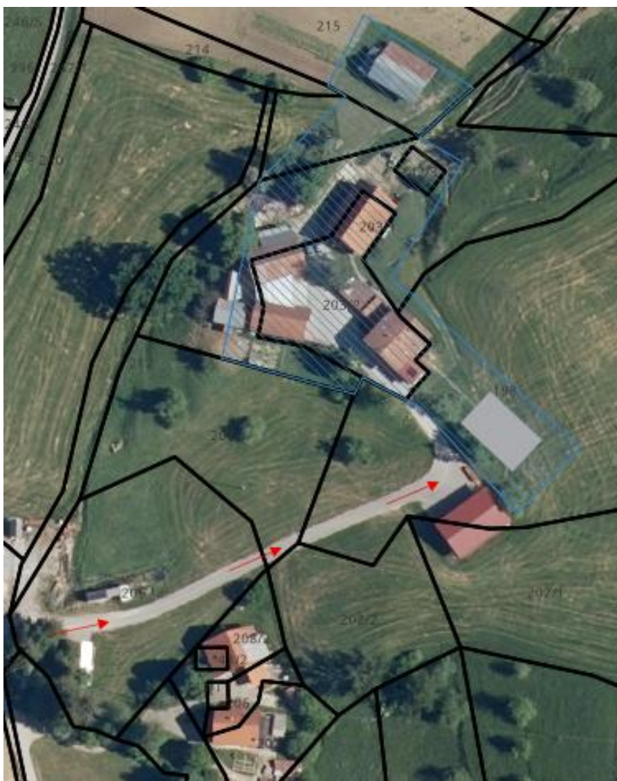
Slika 5: PRIKAZ PREDVIDENE UREDITVE V PROSTORU

Predviden objekt predstavlja ohranjanje obstoječe dejavnosti – bivanje.