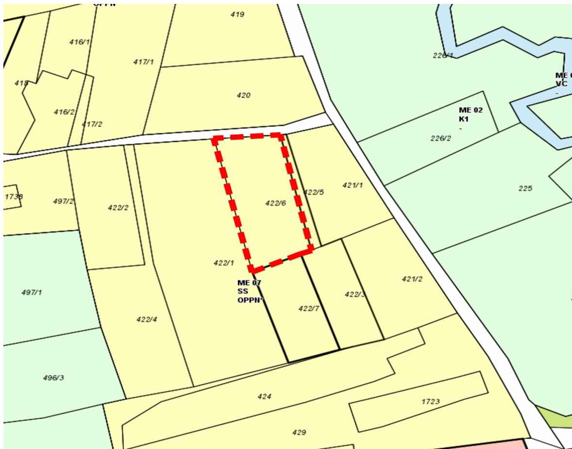
Slika 1: Izsek iz prostorskega plana (vir: https://www.geoprostor.net/piso/ewmap.asp?obcina=smarje pri jelsah )

Skladno s prostorskim aktom (OPN) opredeljuje prostorsko enoto, v kateri se izvaja OPPN za območje EUP ME 07 kot območje, ki je namenjeno stanovanjskim površinam.